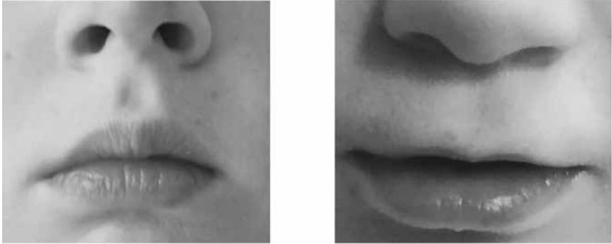
Abbildung 1: Beispiele von Oberlippe und Philtrum

Links: durchschnittliche Ausprägung von Oberlippe und Philtrum (Oberlippe Rang 2 und Philtrum Rang 3 des Lip-Philtrum-Guides von Astley)