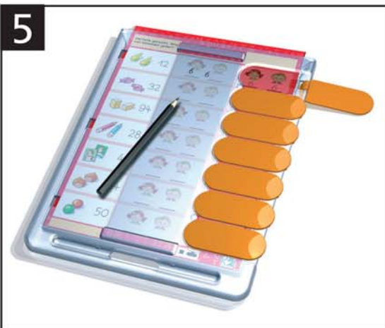
5 Weitere Aufgaben lösen