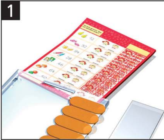
1 Lernkarte einschieben