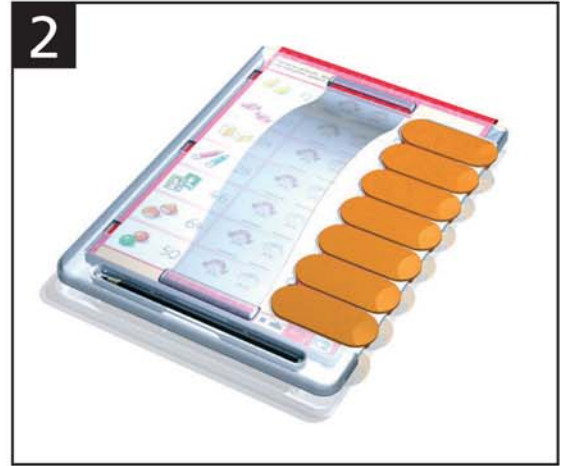
2 Lernstreifen darüber legen