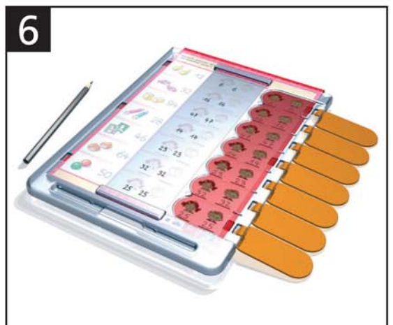
6 Lösungsübersicht - Gesamtkontrolle