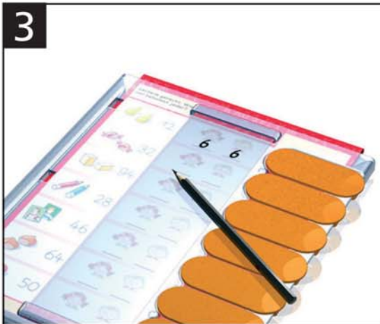
3 Aufgabe lesen - Lösung schreiben